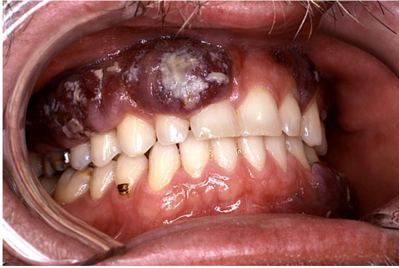
Fotografia 1. Mięsak Kaposiego z nadkażeniem drożdżakowym w jamie ustnej chorego na AIDS.