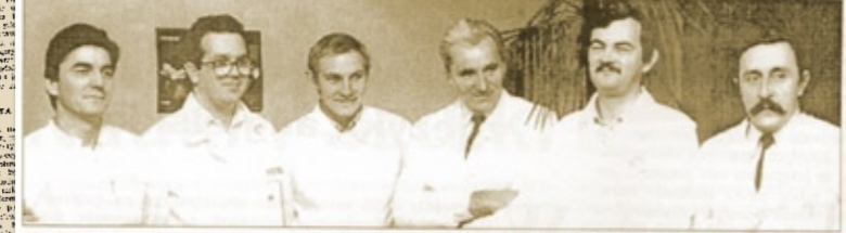
Fot. Zespół pracujący nad zapłodnieniem in vitro bezpośrednio po pierwszym sukcesie (12 listopada 1987 roku o godzinie 9.00 urodziła się dziewczynka, zdjęcie zespołu wykonano o godzinie 11.00).