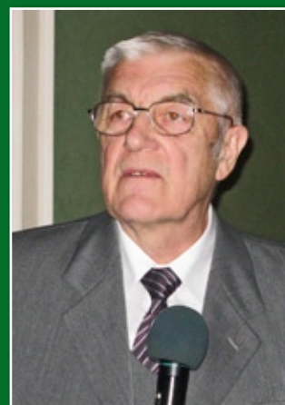
Prof. Maciej Giertych, polityk, naukowiec