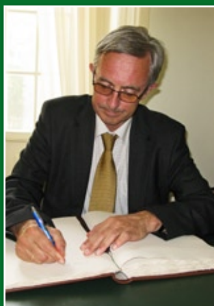
Knut Hauge, ambasador Królestwa Norwegii w RP