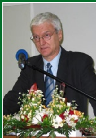
Prof. Michał Kleiber – prezes PAN