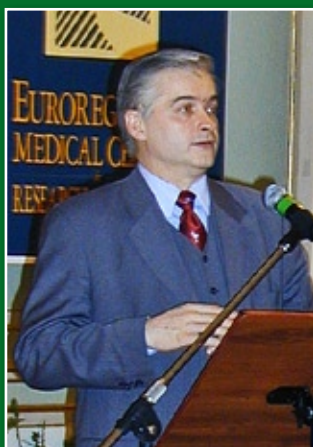
Włodzimierz Cimoszewicz – były minister, marszałek Sejmu