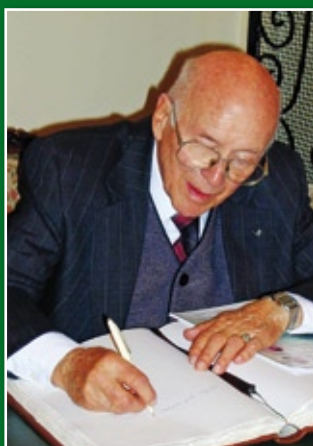
† Jan Nowak-Jeziorański – polityk, żołnierz AK, dziennikarz