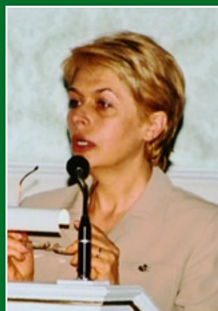
† Izabela Jaruga-Nowacka, była wiceminister, posłanka