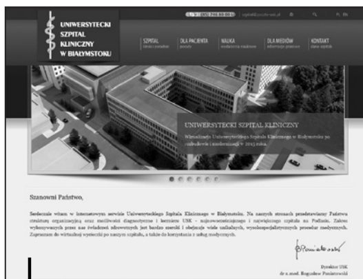
Stronę można obejrzeć pod adresem www.usk.bialystok.pl

z numerem przyporządkowanym konkretnemu pracownikowi. Kody paskowe mają być w przyszłości wykorzystane przy systemie dystrybucji leków. Identyfikatory kryją w sobie jeszcze jedną niespodziankę. Mają wbudowany specjalny mikroprocesor, który w założeniu ma działać jak obecne zbliżeniowe karty płatnicze. W przyszłości ułatwi to życie pracownikom, bo np. zbliżając kartę do odpowiednich czytników, uprawnione osoby będą mogły, bez konieczności wbijania kodów wchodzić na blok operacyjny czy SOR.