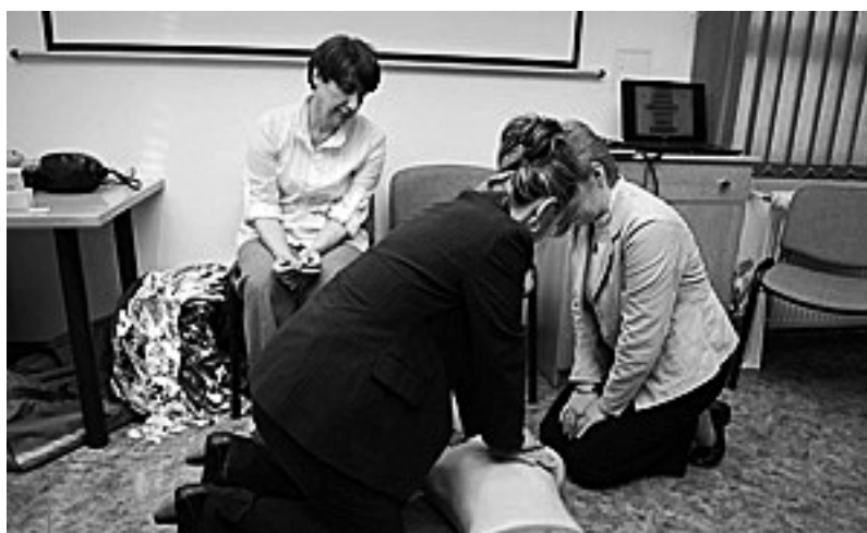
Ćwiczenia praktyczne – resuscytacji krążeniowo-oddechowej dorosłego.