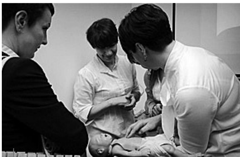
Ćwiczenia praktyczne – resuscytacji krążeniowo-oddechowej noworodka.