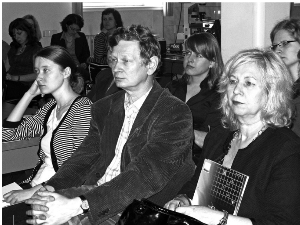
Uczestnicy dwudniowych warsztatów.

Prof. dr hab. n. med., konsultant wojewódzki w dziedzinie pielęgniarstwa położniczo-ginekologicznego, kierownik Zakładu Położnictwa, Ginekologii i Opieki Położniczo-Ginekologicznej UMB.